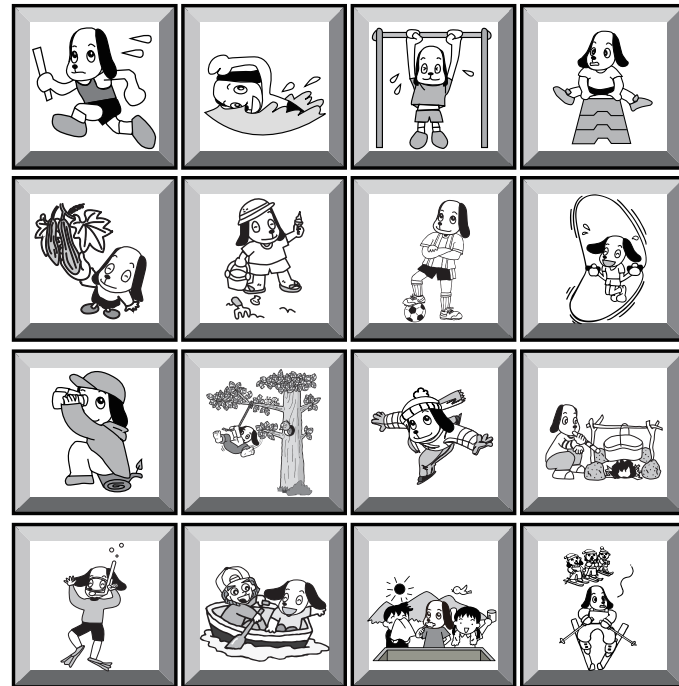
のびのびと、まじめに。